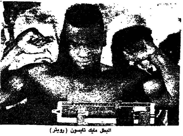
البلبل مايك تايسون